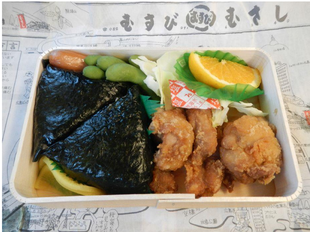
「武藏結」便當(上圖以供參考)