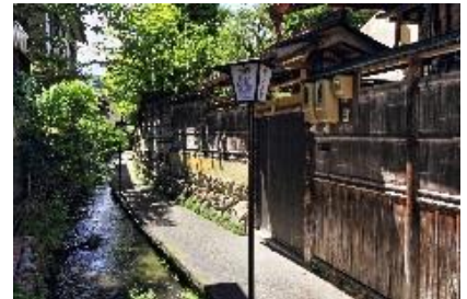
名水的町 郡上八幡