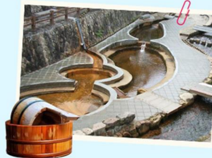
日本三古湯之一，自古以來就是名湯，是世界少有的多成份溫泉，含有鐵質及鹽分的金泉，紓解痠痛和皮膚病；而銀泉可促進血液循環，豐臣秀吉曾數度造訪。