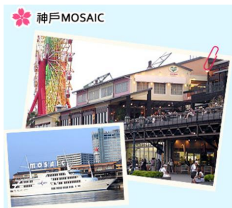
這座臨海的戶外購物商場，匯集了時尚服飾、美食等多家商店，購物之餘也別忘了感受海風輕拂和港灣的美麗夜景。